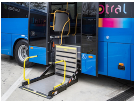
Montage dans l'embarquement à la porte au milieu