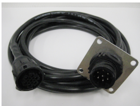
OWE009.06 - Câble de rallongement 6m pour cde. à distance