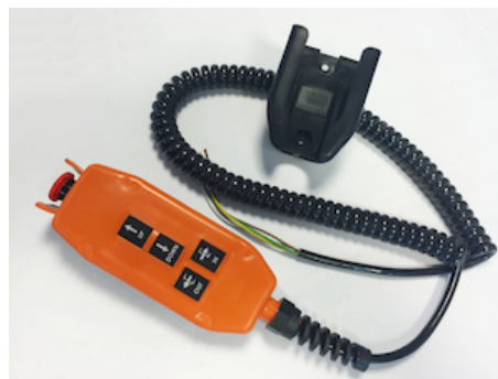
OWE008.4 - Commande à distance 4 boutons + arrêt d'urgence