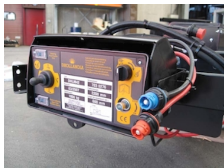
OAE506 - Prise CANNON pour connexion 25mm 2