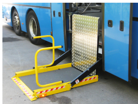
OWP005 - Longueur non-standard de la tôle de passage