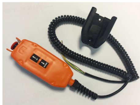
OWE008.2 - Commande à distance 2 boutons + arrêt d'urgence