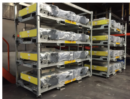
OAA501.05 - Container de transport DH-CH102/103