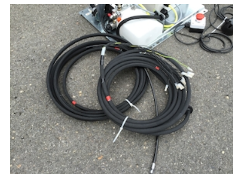
OAH006 - Tuyaux hydrauliques + longueur