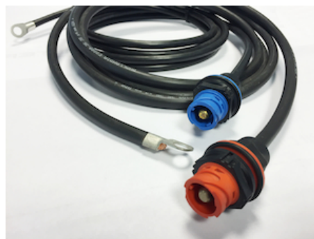
OAE463.25.10D - 2x10m câble de batterie 25mm 2 + prise Cannon