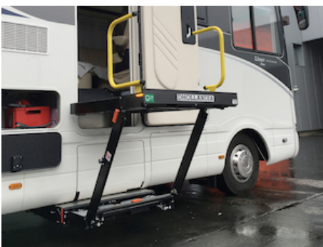
Montages sur-mesure sur des camping cars, remorques médicales etc.