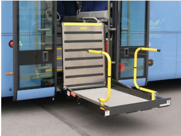
Plateforme robuste en 1 pièce avec 2 rambardes de sécurité, un arrêt de fauteuil automatique au bord arrière et une rampe de passage automatique au board avant de la plateforme