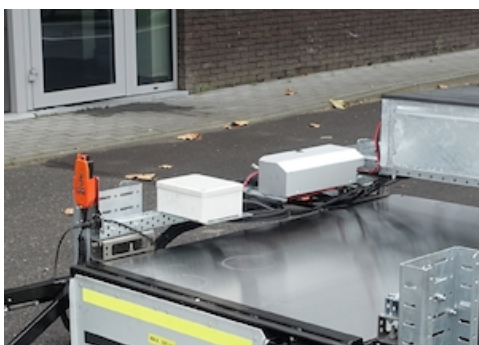
OWH007.1 - Groupe hydr. et caisse électrique séparés