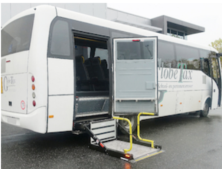
Montage à la porte de secours en dessous du châssis