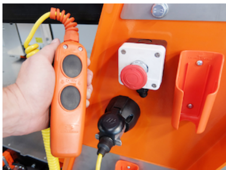
OWE005.01 - Arrêt d'urgence dans une caisse séparée